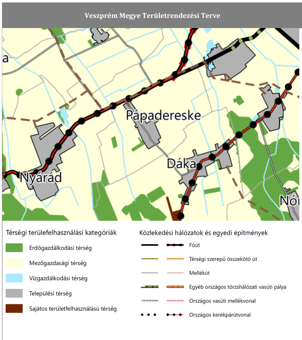
Kivonat Veszprém Megye Területrendezési Tervéből

Veszprém Megye Területrendezési Tervét Veszprém Megyei Önkormányzat Közgyűlése 15/2019. (XII.13.) önkormányzati rendelettel fogadta el. A megye Szerkezeti Tervét M=1:100.000 méretarányban a rendelet 2. melléklete tartalmazza.